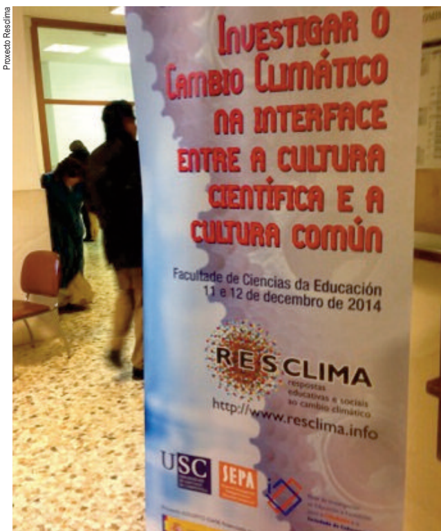
Cartaz do I Seminario Internacional Resclima .