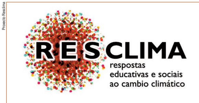
Logo do Proxecto Resclima

Os obxectivos de Resclima sitúanse a dous niveis. O primeiro céntrase na análise das representacións sociais do cambio climático en diferentes grupos de poboación e en diferentes sociedades, principalmente para