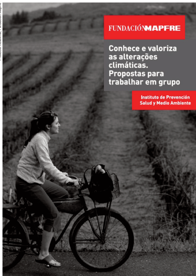
Capa da versión portuguesa da guía “Conhece e valoriza as alterações climáticas”